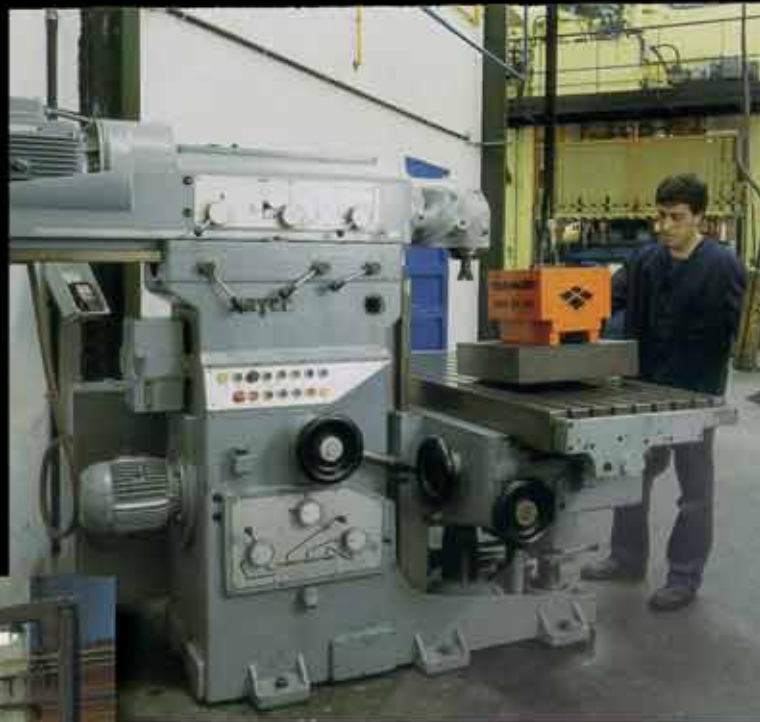
FRESADORA ZAYER MODELO 55 BM