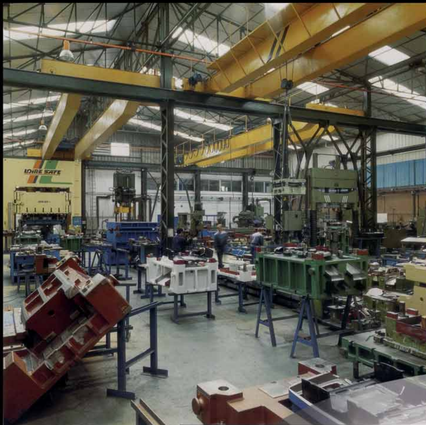
General View of the workshop / Vista general de la nave